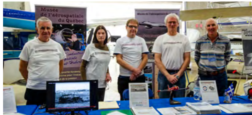
Quelques membres de l'équipe du MAQ lors d'une présentation à l'ÉNA.

6575 chemin de la Savane, Saint-Hubert, (Qc) J3Y 8Y9 Canada