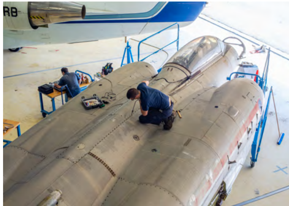
La restauration du CF-100 #100760 demeure une priorité pour l'avenir au MAQ.

C'est pourquoi l'organisation est résolue à garantir un usage strict de ses ressources tout en continuant à offrir de la manière la plus optimale possible du contenu historique ainsi qu'une implication communautaire à la hauteur de ce que la population et l'industrie sont en droit d'attendre.