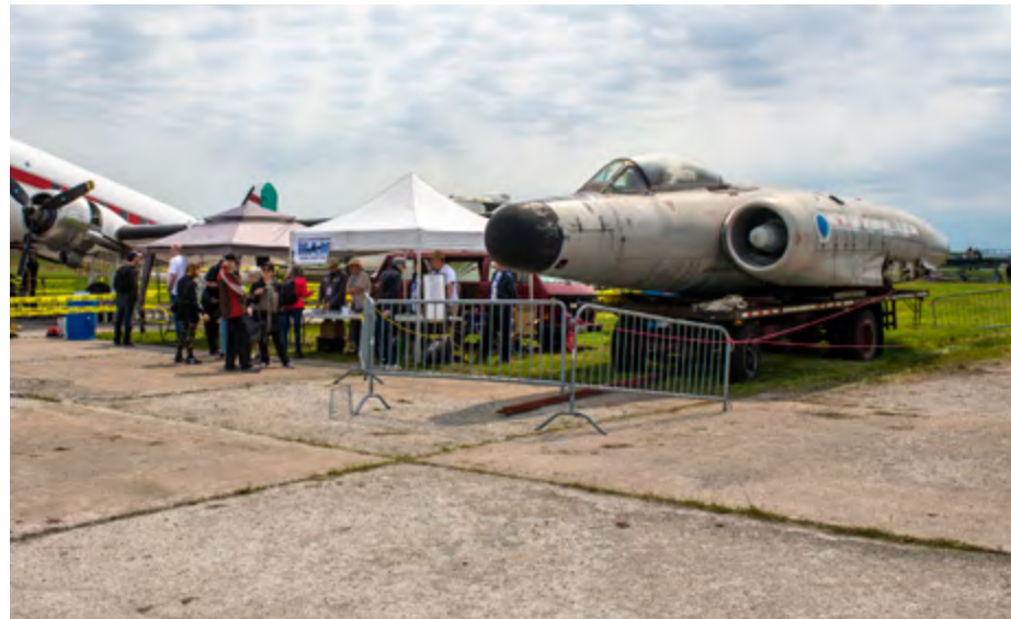
Présence du fuselage de l'Avro CF-100 Canuck 100760 du MAQ aux côtés du DC-3 C-FDTD de l'équipe des Plane Savers lors de l'Aérosalon en juin 2019 à l'aéroport de Saint-Hubert.