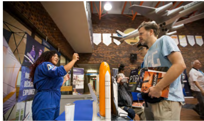
Le kiosque de l'Agence spatiale canadienne suscite l'intérêt des visiteurs lors de la Journée du Patrimoine aérospatial.