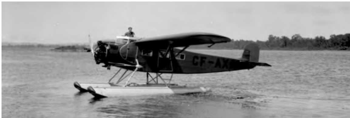
La restauration d'un Fairchild 82 construit à Longueuil fait également partie des intentions du MAQ.

Des recherches et des discussions sont également en cours en vue d'obtenir un hélicoptère Sikorsky CH-124 Sea King, récemment retiré du service de l'aviation royale canadienne, ainsi qu'un Airbus Helicopters SA318C Alouette II modèle d'hélicoptère utilisé à l'époque par Hydro-Québec et engagé dans les grands projets de construction de centrales hydro-électriques de la Baie James qui façonnent aujourd'hui l'histoire du Québec et qui en font sa fierté.